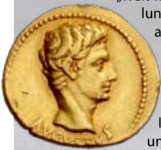
Jrdesmonts via Wikipedia