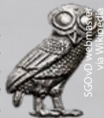
Die Eule der Minerva, Symbol der Illuminaten.

Illuminaten-Experte Abdallah berichtete weiter: „Seit 1990 hat sich in Greifswald ein eigener Illuminatenkreis herausgebildet, der ‚Greifswalder Kreis‘. Dabei handelt es sich um eine linksextremistische, fundamental-naturwissenschaftliche-psychologische Abspaltung traditioneller Illuminatenzirkel. Der Greifswalder Kreis vertritt die Ansicht, dass es die Geisteswissenschaften waren, die den Kapitalismus, die moderne Geißel der Menschheit, hervorbrachten. Um den Kapitalismus zu bekämpfen, müsse man die Geisteswissenschaften bekämpfen.“ Was das alles mit dem Brand in der alten Chemie zu tun hat? Abdallah meint, das Feuer sollte auf die Gebäude der Alten Kinderklinik und Poliklinik übergreifen, in denen das Historische Institut untergebracht ist. „Das wäre das Ende für das Historische Institut gewesen“, so der Mystery-Wissenschaftler abschließend.