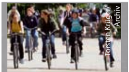
Radfahrer in Greifswald.