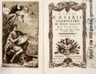
Als Historiker sollte man Cäsar auch im Original lesen können - aber braucht es dafür ein Latein?

Eine Regelung, nach der das Latein bis zum Ende des Grundstudiums abzulegen sei wird es jedoch in den nächsten Semestern nicht geben. „Hierfür wäre eine Änderung der Studienordnung notwendig, womit ein hoher administrativer Aufwand einhergeht. Dennoch wäre eine derartige Regelung auf lange Sicht wünschenswert“, meint Jens Metz, der als Lateinlehrer tätig ist und auch die Lateinprüfung abnimmt.