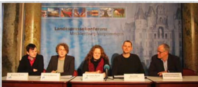
Die Pressekonferenz im Schweriner Schloss.