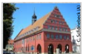
Das Greifswalder Rathaus