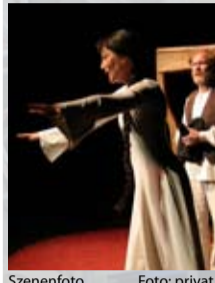
Szenenfoto.