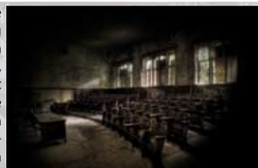
Mit dem Geld will sich der Bund an der Qualitätsverbesserung der Lehre beteiligen.

Studierenden, aber auch eine weitere Professionalisierung in Lehre und Prüfungswesen angezielt.“ Konkret heißt das, dass beispielsweise der Start ins Studium durch einführende Lehrangebote erleichtert werden soll, die Lehre im fakultätsübergreifenden Bachelorstudium verbessert und das forschende Lernen gefördert werden sollen. Koordiniert wird „interStudies“, so Jan Meßerschmidt, durch die integrierte Stabsstelle für Qualitätssicherung. Betroffen wurde die Entscheidung für die Förderung durch ein Gremium, zu dem zwölf Vertreter aus Wissenschaft, Hochschulmanagement, Studierendenschaft sowie je zwei Vertreter des Bundes und der Länder gehören. Die Fachhochschulen in M-V sowie die Uni Rostock erhalten in der zweiten Runde keine Gelder. Bei der ersten Runde waren noch insgesamt vier Hochschulen in M-V gefördert worden, jetzt erhält jedoch nur die Uni Greifswald Förderung.