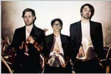
„Fuck Art, let's dance!“

GREIFSWALD. Der Studentenclub Kiste e.V. präsentiert am Samstag, dem 21. Januar 2012, zwei Acts von Audiolith Records, die die Welt des deutschen Elektropunk/Indie zum Beben bringen. Wie sie schreiben, soll ab 21 Uhr die Geschichte der Livemusik in Greifswald neu geschrieben werden, wenn diese beiden Bands in der Kiste die Melancholie und Ratlosigkeit der nächsten Generation in pure Feierlaune und Tanzwut verwandeln werden! Es folgt eine kurze Vorstellung: