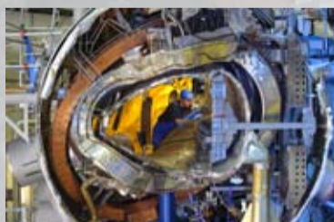
Die Bauarbeiten sollen noch bis 2014 dauern.

GREIFSWALD. Wie das Max-Planck-Institut für Plasmaphysik in Greifswald und Garching mitteilt, ist das letzte große Bauteil der Hülle des Kernfusionsreaktor-Experiments „Wendelstein 7-X“ in Greifswald am 21. Dezember eingebaut worden. Die gesamte Forschungsanlage soll dann 2014 in Betrieb gehen. Bis dahin müssen noch zahlreiche weitere Arbeiten vorgenommen werden. So sind noch die fünf Großkomponenten des Reaktors miteinander zu verbinden, vor allem die Nahtstellen zwischen Stützing, Plasma- und Außengefäß sind zu schließen, die Magneten mit Strom- und Heliumversorgung zu verbinden. Endgültig fertig sein wird die seit 2005 gebaute Basismaschine allerdings erst, wenn die Hauptstromzuführungen, Kühlverrohrungen, Innenausbauten im Plasmagefäß und Kontrollmessungen wie auch Dichtigkeitsprüfungen vorgenommen worden sind. Des Weiteren geht es um die Mittelung des Forschungsinstituts hervor, dass parallel dazu die Systeme zum Aufheizen des Plasmas aufgebaut werden. Daneben sind noch die Versorgungseinrichtung für die elektrische Energie und Kühlung, die Maschinensteuerung und die zahlreichen Messgeräte, die das Verhalten des Plasmas diagnostizieren sollen, zu installieren. Ziel der Fusionsforschung ist es – ähnlich wie die Sonne – aus der Verschmelzung von Atomkernen Energie zu gewinnen. Um das Fusionsfeuer zu zünden,