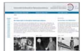
Screenshot der Webseite.