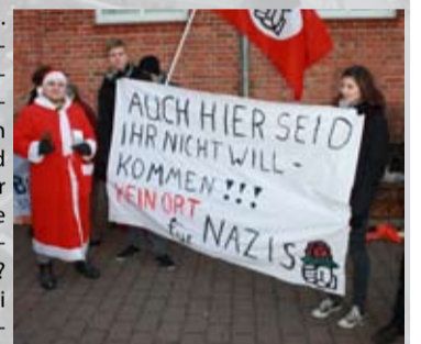
Nach der Busfahrt demonstrierten circa 50 Menschen vor dem Kreistag.