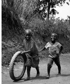
© AFRIKAS RENAISSANCE UND WIEDERAUFBAU E.V.

Eintritt: frei / Spenden zur Unterstützung der Vereinsarbeit willkommen.