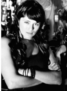
© LOS BOMBEROS D. M. C.

//////////////////// Eine Veranstaltung in Kooperation mit dem IKuWo e.V.